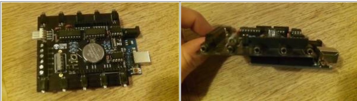
Shield Easybot sur platine Arduino Uno